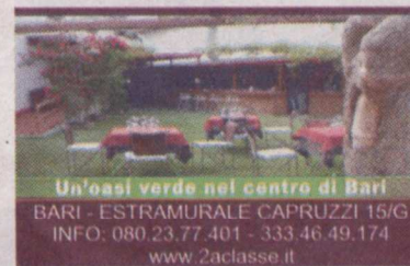
Un'oasi verde nel centro di Bari