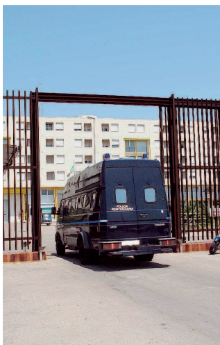
BORG SAN NICOLA L'ingresso del carcere

Polizia penitenziaria sotto stress ma sono in arrivo ulteriori straordinari